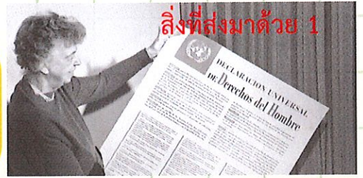
สิ่งที่ส่งมาด้วย 1