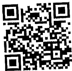
QR code แบบตอบรับ