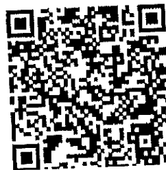
QR code เอกสารประกอบการประชุม