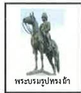
พระบรมรูปทรงม้า