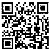
แบบแจ้งรายชื่อ