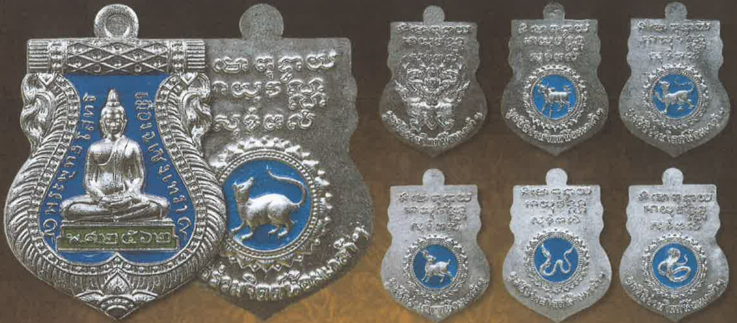
เหรียญเนื้อเงินลงยา บูชาเหรียญละ 2,000 บาท