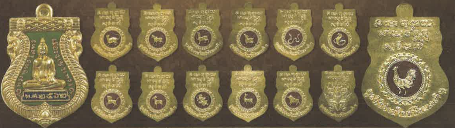
เหรียญเนื้อทองแดงชุบทองลงยา บูชาเหรียญละ 350 บาท