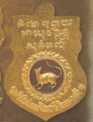
เหรียญเนื้อทองคำลงยา บุษาเหรียญละ: 48,000 บาท