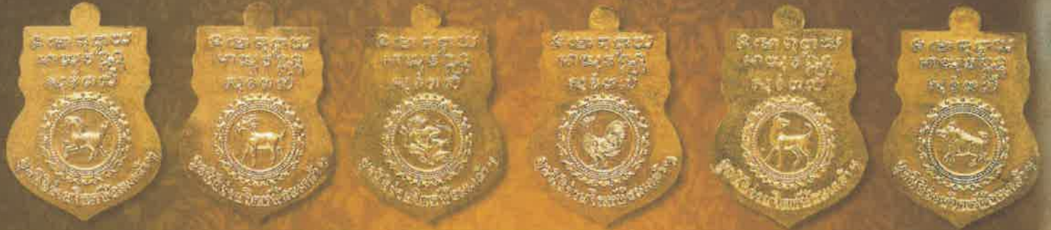
เหรียญเนื้อทองคำ บุษาเหรียญละ: 46,000 บาท