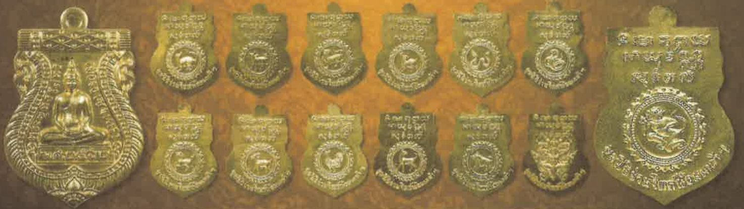
เหรียญเนื้อทองแดงชุบทอง บูชาเหรียญละ 200 บาท