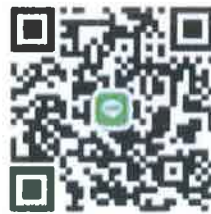
กลุ่มไลน์ “ตอบรับ กง.อก.”

สำนักงานจังหวัด กลุ่มงานอำนวยการ โทรศัพท์ ๐ ๓๘๖๙ ๔๐๐๐ ต่อ ๓๔๑๑๘ โทรสาร ๐ ๓๘๖๙ ๔๑๖๐ E-mail : rayongdirecting@gmail.com