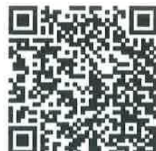
สแกนคิวอาร์โค้ด เพื่อกรอกแบบตอบรับ