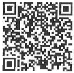
รายงานการประชุม

ฝ่ายเลขานุการฯ กองการอนุญาต โทร. ๐ ๒๕๖๑ ๔๒๙๒ ต่อ ๕๒๐๗ E - mail : meeting.permission64@gmail.com